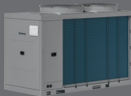
Gerätevariante mit 31 kW bis 41 kW Leistung

Bosch Thermotechnik GmbH, Buderus Deutschland, Bereich SBC, 35573 Wetzlar www.buderus.de, info@buderus.de, Tel. (064 41) 418-1020